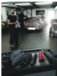
Die Wera Belts